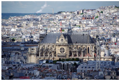
L'église Saint-Eustache au coeur de Paris dans le quartier des Halles

Molière y fut baptisé et enterré, Patti Smith y a chanté et Keith Haring y a une de ses oeuvres, "La Vie du Christ". L'église Saint-Eustache, dans le quartier des Halles, fête cette année ses huit siècles d'existence avec du, 16 février au 25 mai, le spectacle "L'illuminescence", qui illuminera à 360° l'intérieur de l'édifice.