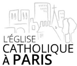
Table ronde « Lueurs d'espoir dans la nuit du monde » mercredi 13 novembre à 20h30 à l'église Notre-Dame d'Espérance, 47 rue de la Roquette à Paris,